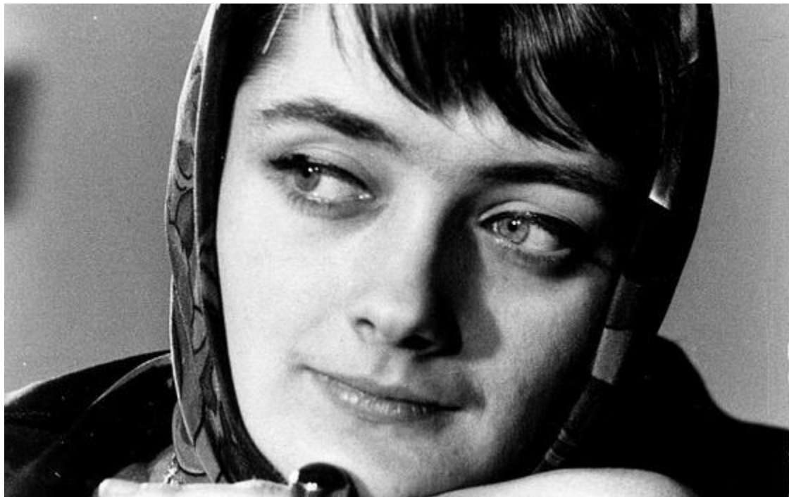
Tanja Kragujević

Ova poezija ima korijene u najboljoj tradiciji jugoslovenske poezije druge polovine prošlog vijeka ali uočljivu konekciju sa srednjeevropskom književnošću, odnosno, pjesništvom